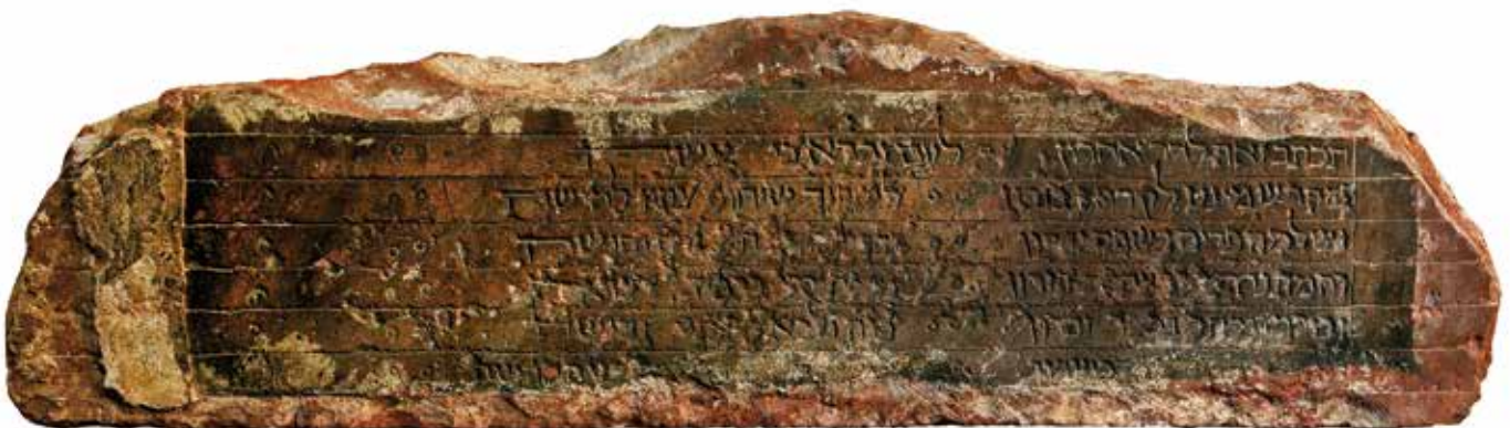
La "pierre des Juifs" ( Judenstein ), vers 1300. Plaque dédicatoire avec inscription en hébreu (musée de la Chartreuse, Molsheim).