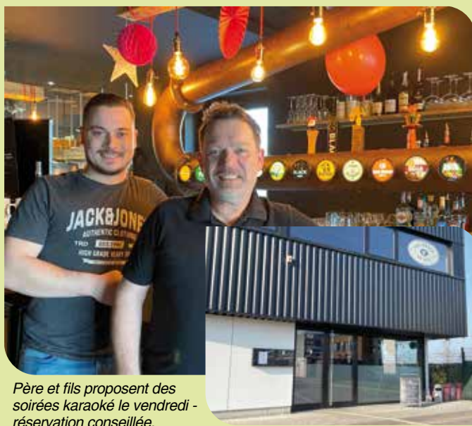
Père et fils proposent des soirées karaoké le vendredi - réservation conseillée.

Heures d'ouverture : tous les midis du lundi au vendredi de 11 h 30 à 14 h - les mercredis, jeudis de 18 h à 22 h, les vendredis et samedis de 18 h à 1 h - tél. 03 88 20 10 92 - https://www.lespotesaufut.fr/ - f i t Les potes au fût