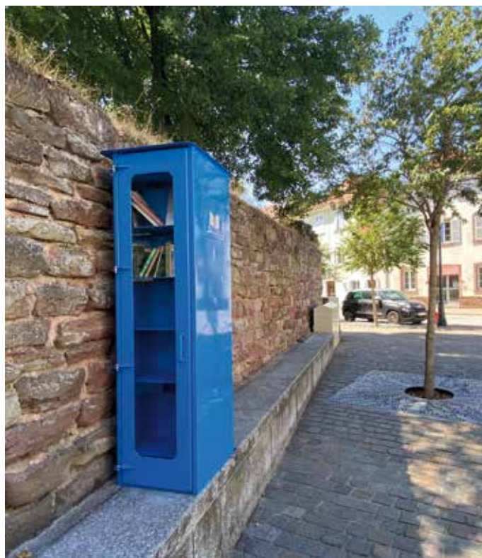
Couleur Bleu Bugatti, la première boîte à livres a été installée rue Saint-Georges début août 2022. Une seconde à vocation internationale sera installée à ses côtés au courant de l'été. Elle abritera des ouvrages multilingues.