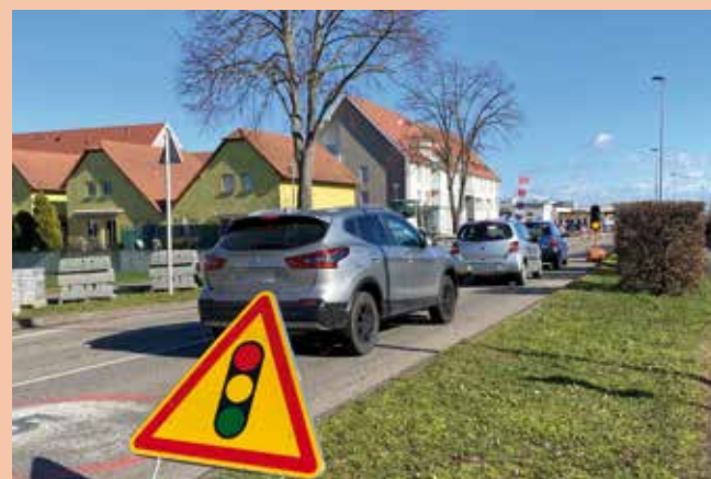
Durant les travaux, la circulation est réduite à une voie sur demi-chaussée.