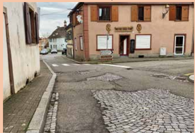
Le chantier s'effectuera par phasages en veillant à traiter les intersections avec les chaussées existantes tout en assurant la desserte des riverains.