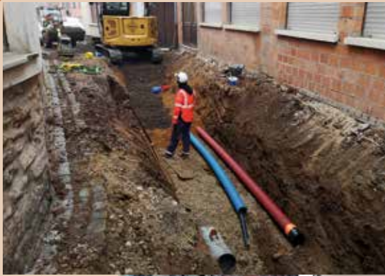
Les travaux de rénovation des réseaux humides ont duré du 6 février au 3 mars.