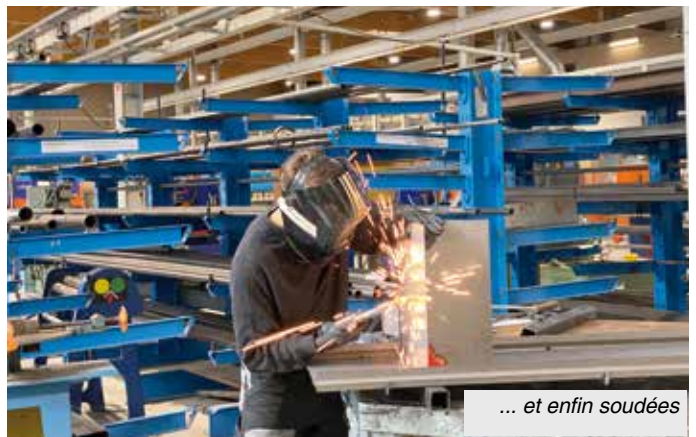
... et enfin soudées