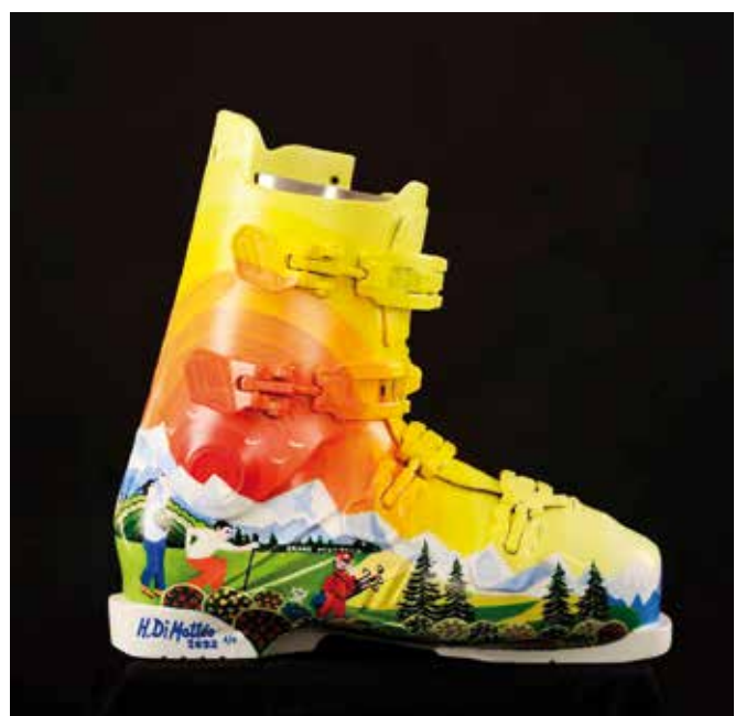
Peinture sur chaussure de ski - 2022. Collaboration HDM - DDM 1965