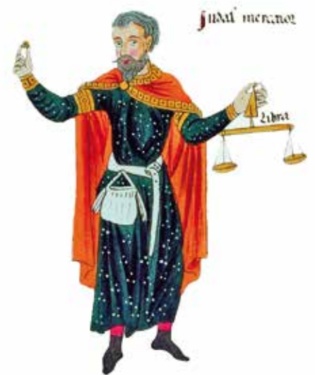
Représentation au XII e siècle d'un marchand juif avec sa balance monétaire (d'après le Hortus Deliciarum).

Il semblerait d'ailleurs que les terres épiscopales aient offert davantage de protection et que, de ce fait, "la ville de Molsheim n'ait point été souillée du sang des juifs". Il est toutefois plus probable qu'après le traitement réservé aux juifs à Strasbourg, leurs coreligionnaires de Molsheim n'aient dû leur salut qu'à la fuite, en laissant tout ce qu'ils possédaient derrière eux.