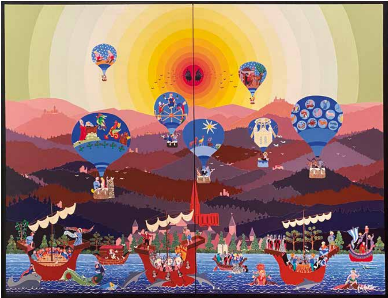
"Hortus Deliciarum" ou "Jardin des délices" - 2014 - acrylique sur lin 120 x 160 cm. Tableau inspiré par le manuscrit éponyme composé entre 1159 et 1175 par Herrade de Landsberg