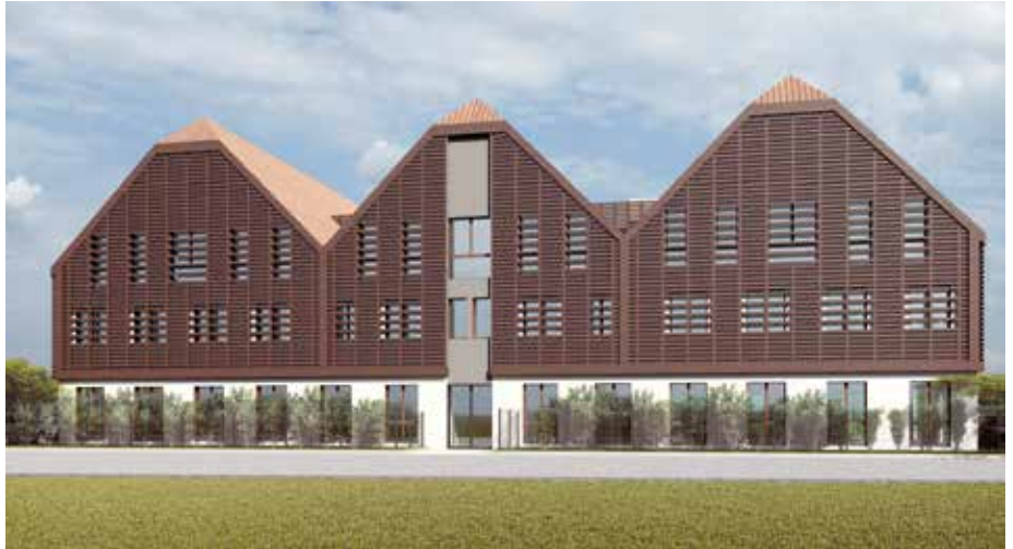
C'est sur le site de l'ancien Jardina que la Maison médicale verra le jour visuel non contractuel - ©Atelier d'architecture G5

Inauguré en septembre 2022, l'Espace de santé situé au 30 rue des Vergers regroupe déjà treize spécialités médicales ou para médicales (gynécologue, ostéopathe, infirmier, neurologue, psychologue, médecin généraliste, angiologue, dentiste, rhumatologue sage-femme, massage bien-être, sophrologue et endocrinologue). La cité Bugatti entreprend d'élargir et de consolider l'offre de santé sur son territoire et s'est adjoint la compétence du promoteur immobilier KS Promotion de Bischheim. D'une superficie de 2 000 m 2 , le futur pôle permettra d'accueillir les professionnels de santé dans des locaux modernes accessibles à tous les patients en lieu et place des anciennes serres Jardina. Pour l'heure, la Ville a