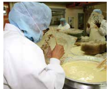
Les moulages creux produits à Molsheim pouvaient présenter jusqu'à neuf coloris différents.

Depuis 2021, Cémoi fait partie du groupe familial belge Sweet products. Le groupe invoque le contexte inflationniste et explique, dans un communiqué de presse, vouloir se "concentrer sur son savoir-faire historique de fabricant de chocolat à destination des industriels et des métiers de bouche et à continuer à développer des marques permanentes". Début mars, trois entreprises agroalimentaires ont fait valoir leur intérêt pour le site. Les pourparlers sont en cours.