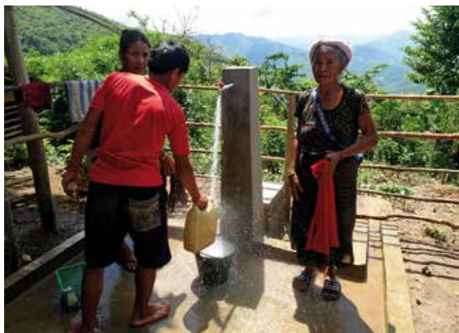
Dans le village de Sanphoulouang perché à 1 065 mètres sur une crête, les habitants ont désormais accès à l'eau potable grâce à l'action d'ADV Laos.