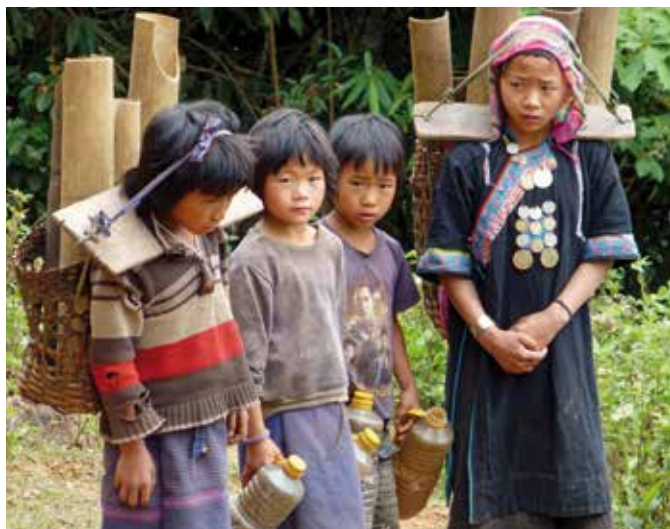
Quand il s'agit de puiser l'eau potable dans les sources plus ou moins éloignées, ce sont les petites filles des villages qui s'y collent au lieu de fréquenter l'école...

Aujourd'hui, ADV Laos se concentre sur des objectifs de développement durable. “La gestion de la ressource en eau reste primordiale car si nous assurons à des familles l'accès à l'eau potable, il faut également leur faire adopter des comportements responsables d'usage de l'eau” .