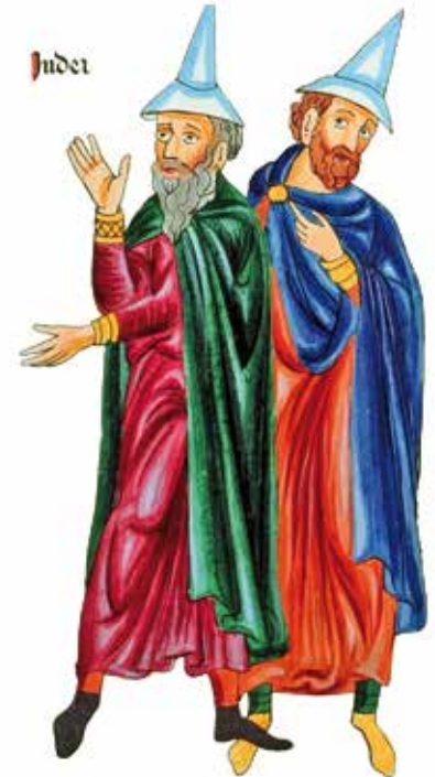
Deux juifs au Moyen Âge, reconnaissables à leur barbe fournie et à leur chapeau pointu (d'après le Hortus Deliciarum ).

Comme la plupart des synagogues du Moyen Âge, le sanctuaire de Molsheim devait être une construction de dimension modeste et d'apparence discrète. Lieu de réunion et d'enseignement, il regroupait autour de lui différents bâtiments (dont les bains rituels) permettant de supposer que toute la vie communautaire se déroulait à cet endroit. L'emplacement exact de la synagogue reste inconnu mais, en son souvenir, une copie en résine du fameux Judenstein (réalisée par l'atelier de sculpture Keller, de Molsheim),