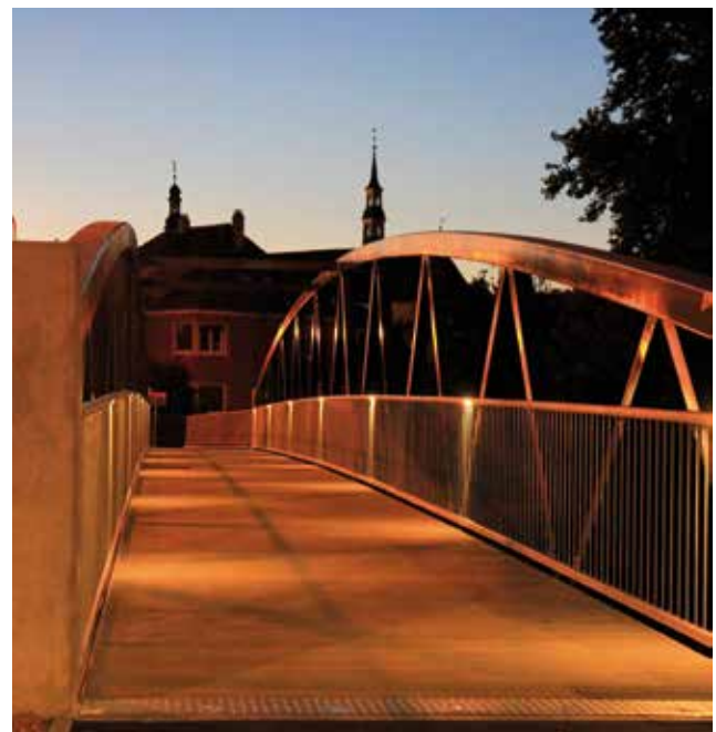
L'éclairage des deux passerelles encadrant le pont de l'Union européenne sera intégré au garde-corps à l'image de celui effectué pour la passerelle de l'avenue de la Gare.