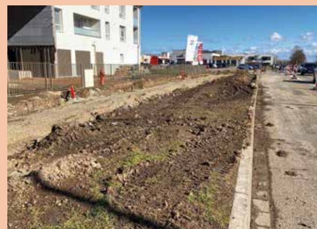
Afin de permettre l'élargissement de la chaussée pour installer le tourne-à-gauche, le trottoir initial sera déplacé vers les habitations