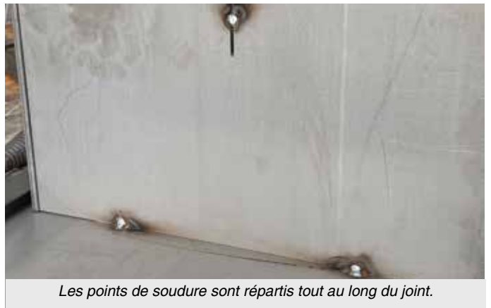
Les points de soudure sont répartis tout au long du joint.