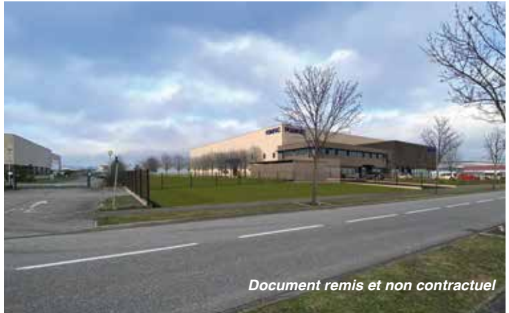
Document remis et non contractuel

Un volume de vente de 398 m 2 consacré à la fois aux particuliers et aux professionnels complète l'offre commerciale. À cela s'ajoute un entrepôt de stockage (3 125 m 2 ). L'implantation de cette enseigne s'accompagne de la création de 35 emplois.