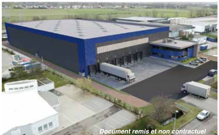
Document remis et non contractuel

L'ensemble des surfaces non utilisées par la construction et les voiries sera engazonné et végétalisé.