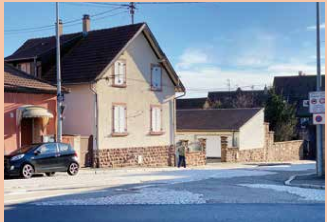
La chantier de voirie s'étendra du tronçon de la rue de Saverne situé entre l'avenue du Général de Gaulle et la place de l'Hôtel de Ville.

Le pavage en pierre naturelle est requis. Sa mise en œuvre est plus complexe, plus longue et plus onéreuse qu'un simple chantier. Dès que le projet d'aménagement sera dessiné, une réunion informative pour les riverains sera organisée.