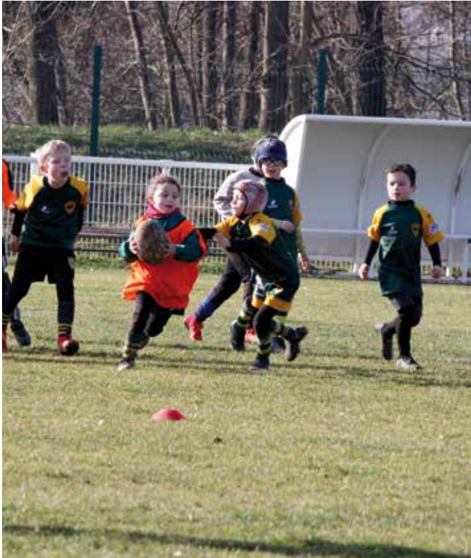
En catégorie mini-poussin, les enfants découvrent les premiers rudiments de rugby : passer le ballon, soutenir ses partenaires et surtout respecter les règles.

d'équipe et j'aime le contact. Je suis plutôt du genre à foncer dans le tas". Celle qui évolue au poste de deuxième ou de troisième ligne adore pousser dans les mêlées et estime avoir gagné en maturité... L'école de rugby c'est l'école de la vie : à chaque étape l'enfant continue son parcours vers l'autonomie. Afin d'offrir de belles opportunités à ses joueurs, le Mom a créé une entente avec Strasbourg Alsace Rugby à partir de la catégorie M16. "Certains cadets qui souhaitent notamment s'orienter vers la compétition rejoignent Strasbourg à l'issue de leur cursus en section sportive au collège Henri Meck".