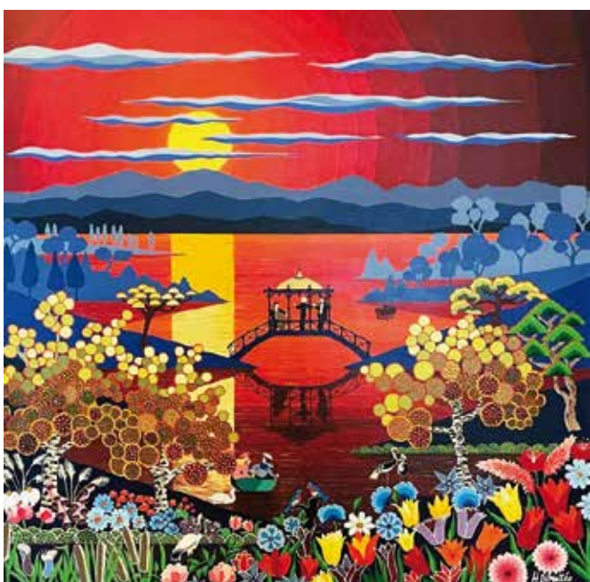
Aubade pour une Aurore nouvelle - 2021. Acrylique sur lin 100 x 100 cm