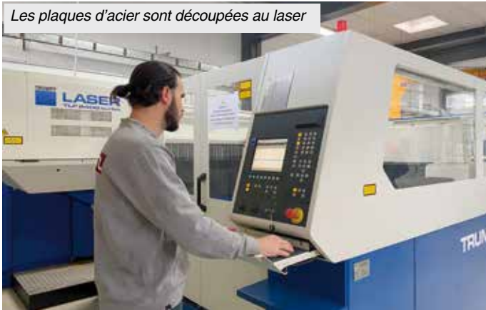
Les plaques d'acier sont découpées au laser