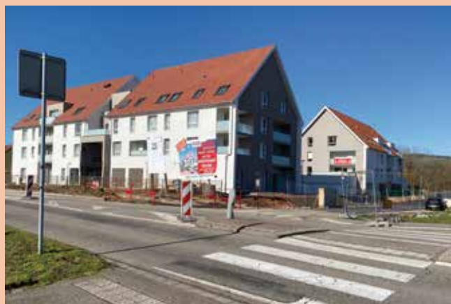
Avec la création du tourne-à-gauche, l'îlot central et le passage piéton existants seront supprimés pour sécuriser l'accès aux trois immeubles.

Le montant du projet s'élève à 175 000 euros TTC. Cette opération permettra de fluidifier le flot des véhicules aux abords de Promogim.