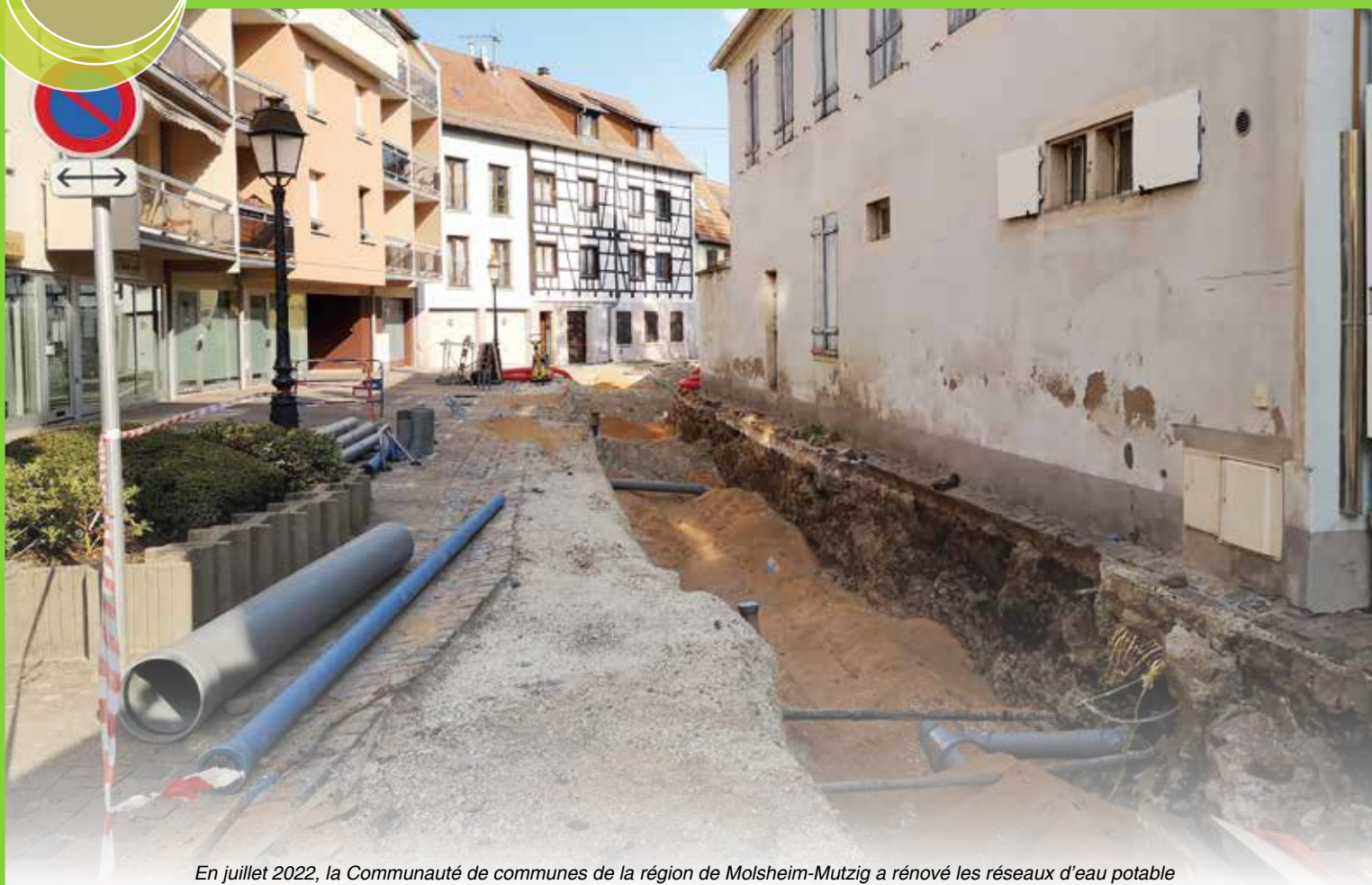
En juillet 2022, la Communauté de communes de la région de Molsheim-Mutzig a rénové les réseaux d'eau potable et d'assainissement de la rue des Capucins