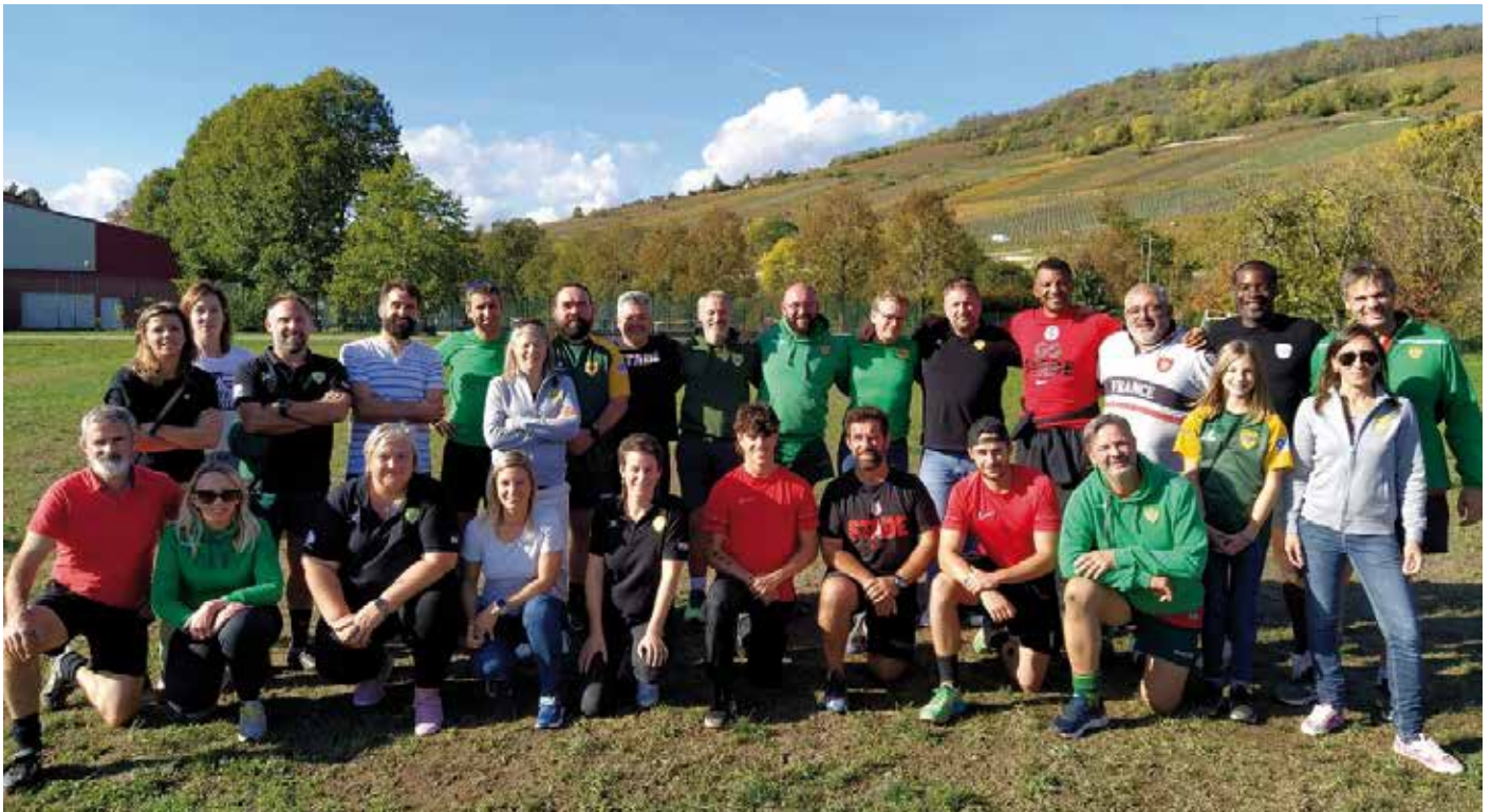
Durant les vacances de la Toussaint, le Stade toulousain Académie, emmené par l'ancien international Émile Ntamack (4 e en partant de la droite au 2 e rang), a encadré un stage de trois jours sur les terres du Mutzig ovalie Molsheim. 100 jeunes issus de clubs alsaciens dont le Mom ont touché l'excellence. L'essai devrait être transformé en 2023 (Document remis).

En savoir plus : responsableedrmom@gmail.com