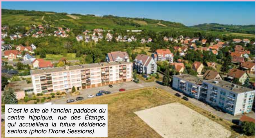
C'est le site de l'ancien paddock du centre hippique, rue des Étangs, qui accueillera la future résidence seniors (photo Drone Sessions).

La Société d'économie mixte Alsace habitat, a manifesté son intérêt pour réaliser ce programme qui comportera 34 logements conventionnés et 20 en financement libre.