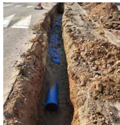
Au printemps 2022, des travaux de rénovation du réseau d'eau potable ont été entrepris au quartier Henri-Meck.