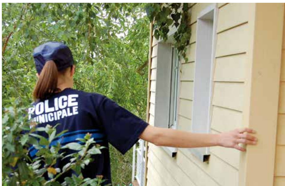
L'opération tranquillité vacances remporte chaque année un franc succès et représente une des missions adoptées à l'échelle pluricommunale (sauf Avolsheim).