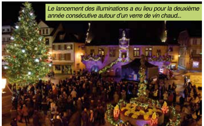
Le lancement des illuminations a eu lieu pour la deuxième année consécutive autour d'un verre de vin chaud...