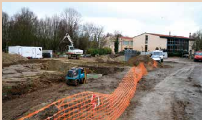
Le tracé de la future voirie reliant la rue des Remparts à la rue des Sports est déjà matérialisé.

Le chantier entrepris dès la fin septembre concerne à la fois la construction d'un ouvrage destiné à franchir le canal de la Bruche dans le prolongement de la rue des Remparts et la création d'une voirie sur l'emprise de l'ancien centre hippique. Côté ouvrage, les travaux de remblaiement et d'étanchéité sont terminés. Il ne restera plus qu'à l'entreprise Roca, attributaire du marché, de poursuivre avec la pose des garde-corps courant janvier. De son côté Eiffage Route a débuté les travaux d'assainissement.