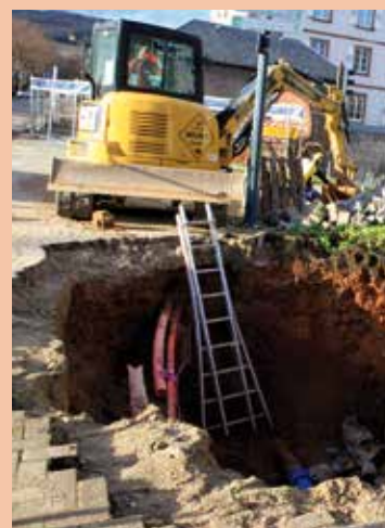
Des aménagements du réseau d'eau potable ont nécessité une coupure d'eau dans une partie du quartier situé autour du canal Coulaux.

de la Communauté de communes de la région de Molsheim-Mutzig. D'une longueur de 48 m pour une largeur de 3 m, la future passerelle cyclable bidirectionnelle en armature métallique et platelage en béton antidérapant devrait être acheminée en deux convois de fin janvier à fin février 2020. Une passerelle enjambant le canal Coulaux est également en cours de réalisation.