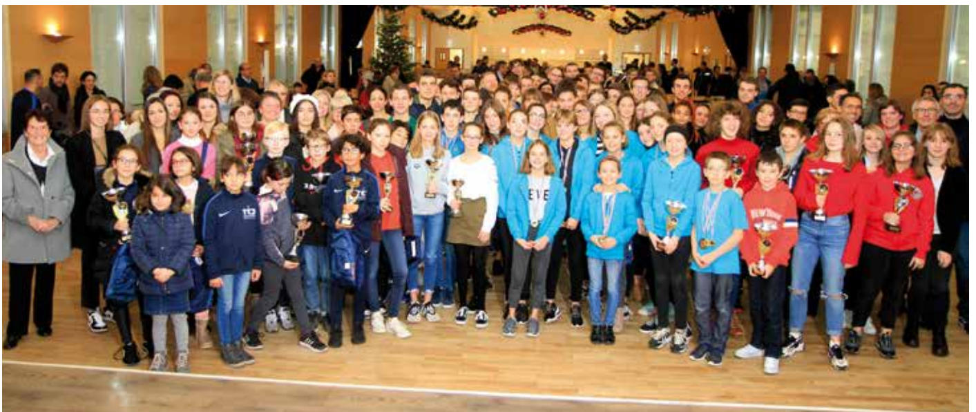
Qu'ils soient poussins ou vétérans, les champions ont tous été ravis de brandir leur coupe. Bravo à tous ces athlètes et à leurs encadrants qui permettent à la Ville d'écrire d'aussi belles pages sportives.