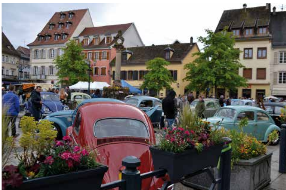
Depuis 2005, le Cox show accueille des combi et des coccinelles venus des quatre coins de France et d'Europe. De 104 la première année à près de 700 véhicules en 2019 ! Les organisateurs ambitionnent d'en rassembler 800 à l'occasion des festivités liées aux 1200 ans de Molsheim.