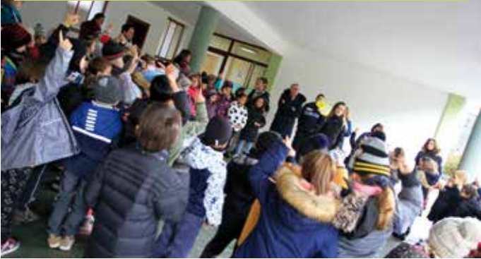
140 élèves de CP ont reçu le casque et le gilet, équipement indispensable pour bien circuler à vélo.