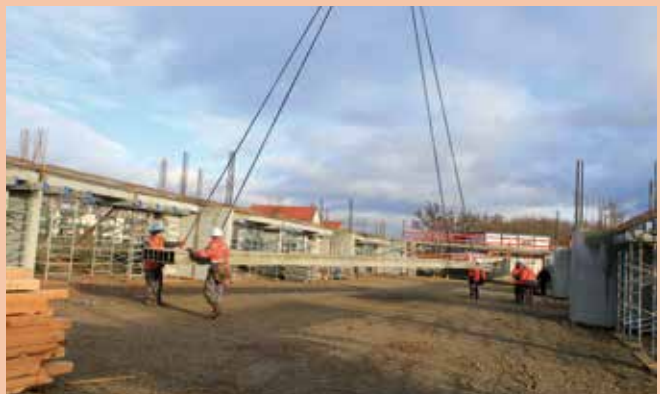
L'entreprise Sotravest procède à la pose des planchers formés d'éléments de dalles alvéolées.