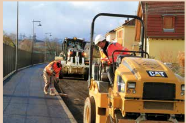
Avant la pose des enrobés, les ouvriers ont procédé aux derniers réglages de nivellement et de compactage.

climatiques. Au final, la chaussée présente une largeur minimale de 3,50 m dans la partie basse et restera donc en sens unique de l'avenue de la Gare jusqu'à l'emprise d'Orange en amont de la rue de la Truite. Elle s'élargira ensuite jusqu'à 5,40 m maximum vers la rue Ernest Friederich. La piste cyclable bidirectionnelle aménagée le long de la voie ferrée permettra aux vélos et aux piétons de circuler en toute sécurité.