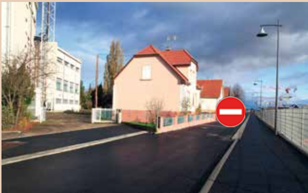
Du 1 au 6 rue de la Fonderie (Entreprise Orange), la rue de la Fonderie sera à sens unique de l'avenue de la Gare vers la rue Ernest Friederich.

Les travaux entrepris dès le 23 septembre touchent à leur fin. Eiffage Route a réalisé la première couche de roulement afin de permettre une ouverture de la rue à la circulation avant Noël. La signalisation horizontale et verticale ainsi que la dernière couche de roulement sont prévues courant janvier en fonction des conditions