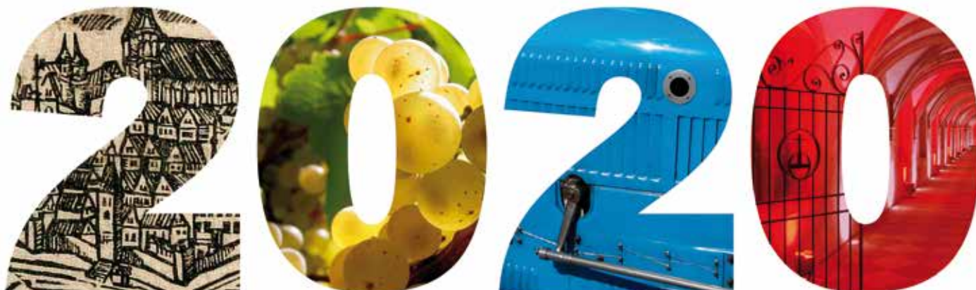
Le logo officiel de 2020 : 1200 ans d'Histoire à Molsheim associant le dessin de Jean-Jacques Arhardt de 1644 représentant la ville et ses monuments, le vignoble, l'épopée industrielle avec Bugatti et, enfin, le patrimoine culturel avec la Chartreuse (Réalisation Damien Schitter).