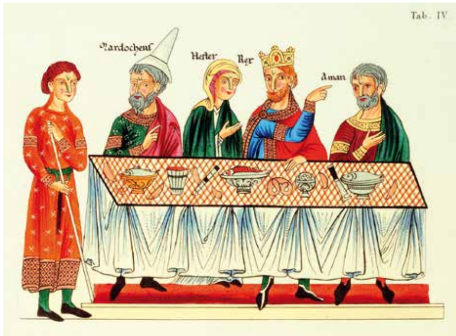
La table du souverain à la fin du XII e siècle.

D'après la copie partielle du Hortus Deliciarum (pl. IV), publiée en 1818 par C.-M. Engelhardt.