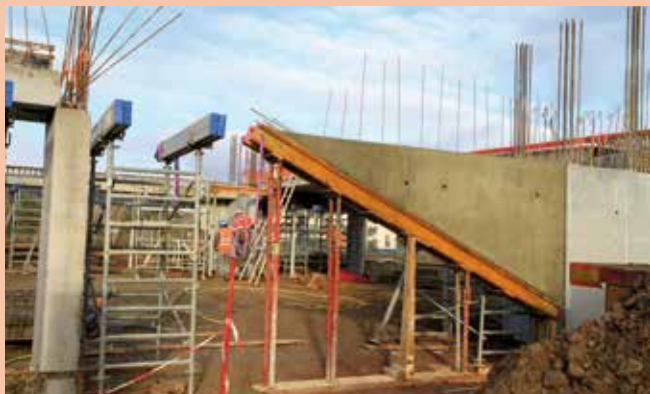
On devine déjà l'accès piétons aux futurs escaliers du parking.