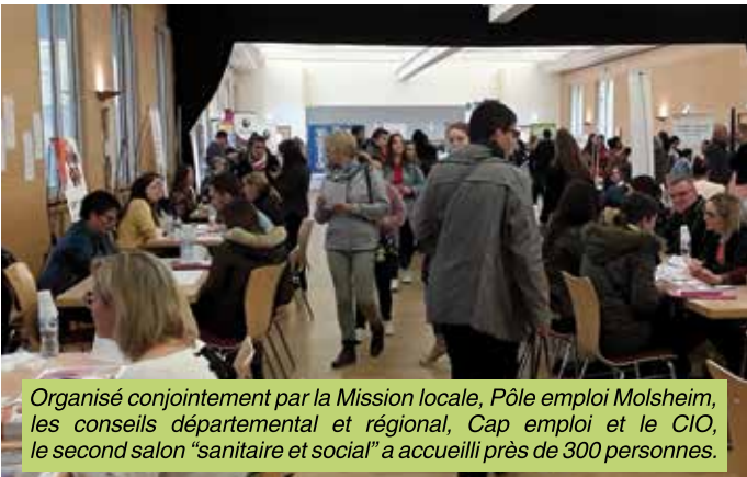
Organisé conjointement par la Mission locale, Pôle emploi Molsheim, les conseils départemental et régional, Cap emploi et le CIO, le second salon "sanitaire et social" a accueilli près de 300 personnes.