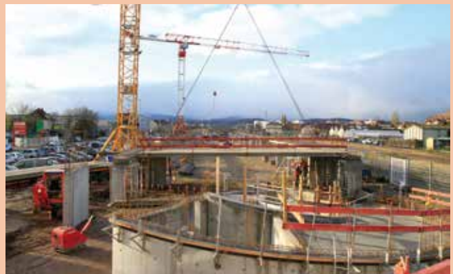
Au premier plan, se trouve la rampe Nord qui assurera l'accès des véhicules à la structure.

L'entreprise Sotravest a entrepris les terrassements du parking en ouvrage début septembre. D'une longueur de 155 m sur une largeur de 16 m, la structure atteindra une hauteur de 12 m et disposera de quatre plateaux d'une capacité d'une centaine de places de stationnement chacun. 4000 m 3 de béton et 190 tonnes d'armatures en acier seront nécessaires pour assurer l'habillage de cet ouvrage. Une rampe située côté Nord (rue du Gibier) permettra l'accès des véhicules. La rampe côté Sud est dédiée à la sortie des véhicules. Le parking devrait être opérationnel pour la rentrée scolaire 2020- 2021.