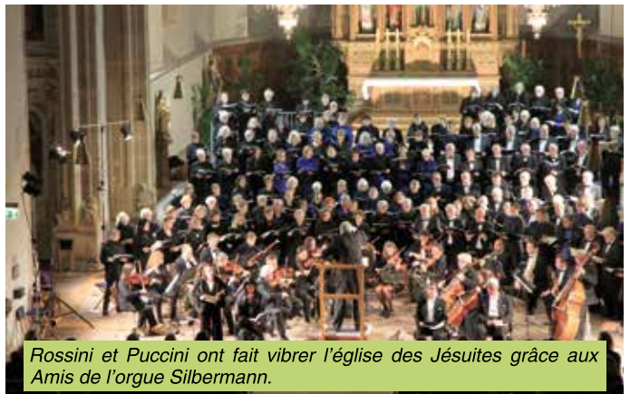
Rossini et Puccini ont fait vibrer l'église des Jésuites grâce aux Amis de l'orgue Silbermann.