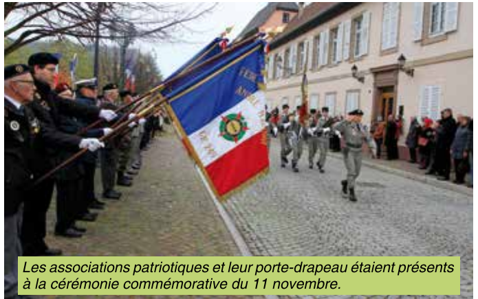
Les associations patriotiques et leur porte-drapeau étaient présents à la cérémonie commémorative du 11 novembre.