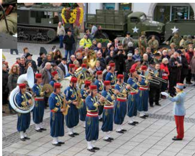
La fanfare militaire du 1 er régiment des tirailleurs d'Epinal a animé la cérémonie commémorative de la plus belle des manières.

De nombreux bénévoles en uniforme militaire étaient présents.