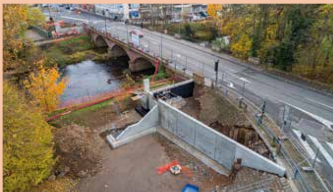
Les culées en béton situées rive droite et rive gauche de la Bruche ont déjà été réalisées. Un muret de protection contre les crues de la Bruche est en cours de construction côté ancien skate-parc.

Les travaux d'aménagement d'une piste cyclable avenue de la Gare se poursuivent sous le contrôle