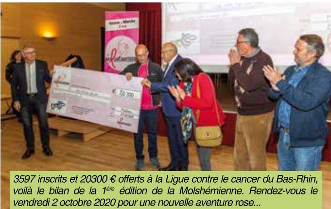
3597 inscrits et 20300 € offerts à la Ligue contre le cancer du Bas-Rhin, voilà le bilan de la 1 ère édition de la Molshémienne. Rendez-vous le vendredi 2 octobre 2020 pour une nouvelle aventure rose...