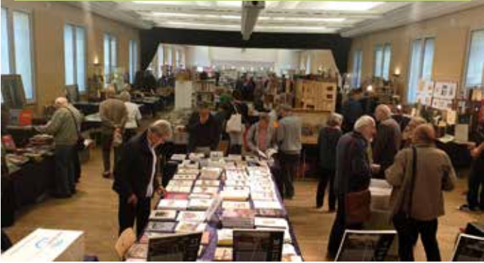
Le salon du livre ancien se tenait cette année au 1 er étage de la Monnaie.