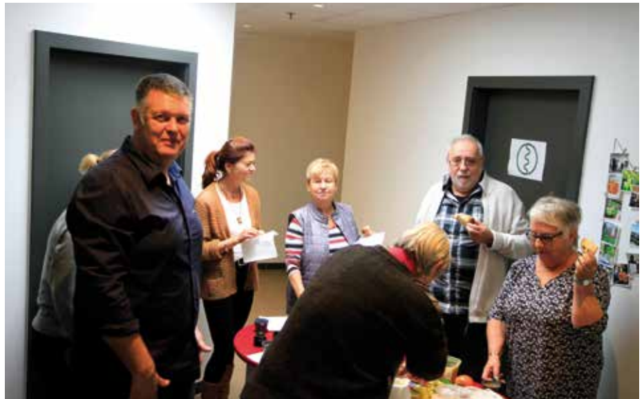
Après l'effort, le réconfort ! Entre deux séances, place au goûter pour reprendre des forces et laisser reposer ses méninges...