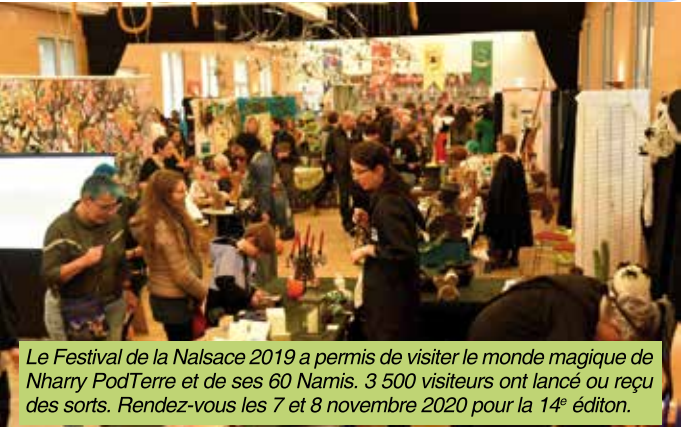
Le Festival de la Nalsace 2019 a permis de visiter le monde magique de Nharry PodTerre et de ses 60 Namis. 3 500 visiteurs ont lancé ou reçu des sorts. Rendez-vous les 7 et 8 novembre 2020 pour la 14 e édition.