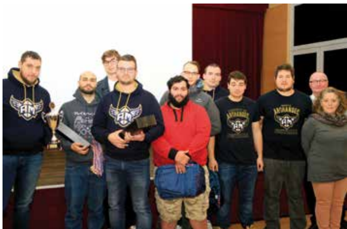
Pour leur deuxième saison, les Archanges de Molsheim (football américain) sont devenus champions Grand Est poule Est en Régionale 2.