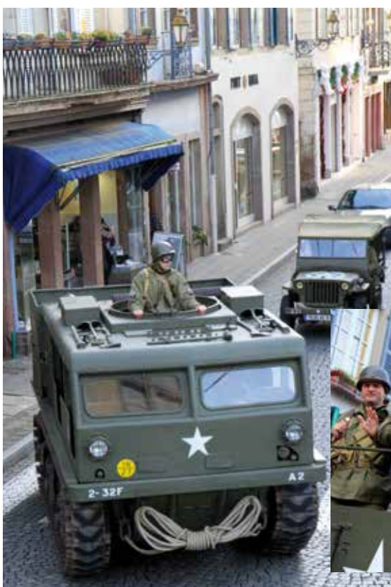
Le M4 High speed tractor était l'un des 25 véhicules d'époque présents aux côtés des jeeps Willys, des dodges, des GMC, half-track. Des tractions complétaient le défilé...