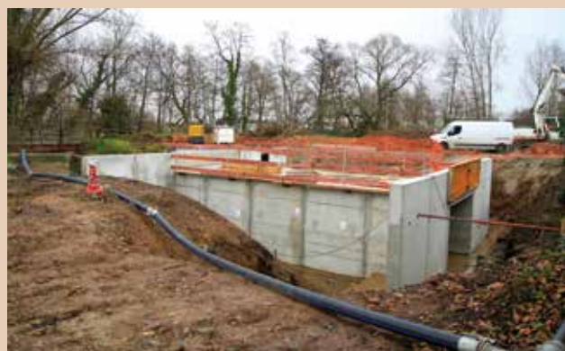
L'ouvrage construit par l'entreprise Roca permettra à la fois aux piétons, aux cycles et aux voitures de traverser le canal de la Bruche.